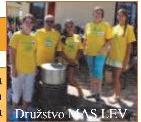
Družstvo MAS LEV