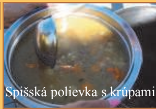
Spišská polievka s krúpami

Konštatujeme, že 20 litrov spišskej polievky s údeným mäsom, na ktorú sme stáli, sa v ochutnávkovom režime minulo v priebehu jednej hodiny po dovarení. Takže buď naozaj chutila, alebo je v území organizátora veľa hladošov.