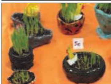
Tvorba v chránenej dielni

Tvorba v chránenej dielni sa orientuje na ručnú výrobu darčekových predmetov, škatuliek, pomôcok a hier pre zrakovo postihnutých.