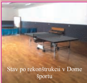
Stav po rekonštrukcii v Dome športu

Vytváranie si vzťahu k športu sa formuje u človeka počas celého života. Je nie veľmi potešiteľné, čo som sa dočítala v štatistikách, že len 10% detí sa venuje pohybovej aktivite vo voľnom čase, zvyšné percento sústreďuje svoj záujem na výpočtovú techniku, osobitne videohram, filmom, internetu. V Studenci tomu tak nie je, čo teší nielen nás, ale aj vedenie obce, ktoré sa rozhodlo investovať financie