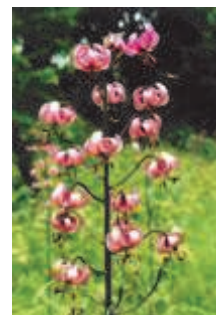
Palia zlatohlavá Lilium martagon