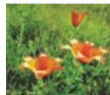
Palia cibul'konosná Lilium bulbiferum